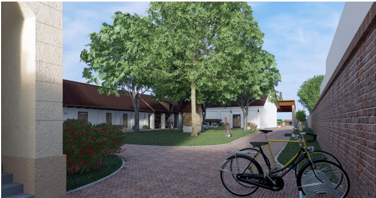
Vizualizacija - Dvorište i pogled na pomoćne zgrade