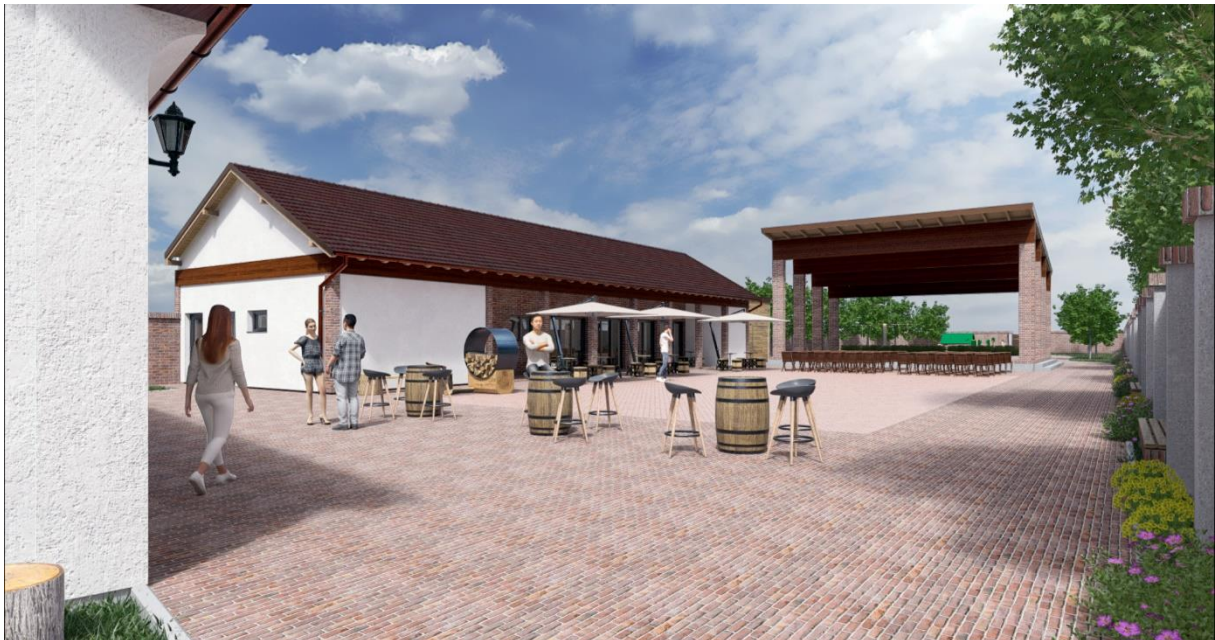
Vizualizacija - Stražnje dvorište – prostor za degustaciju sa pozornicom