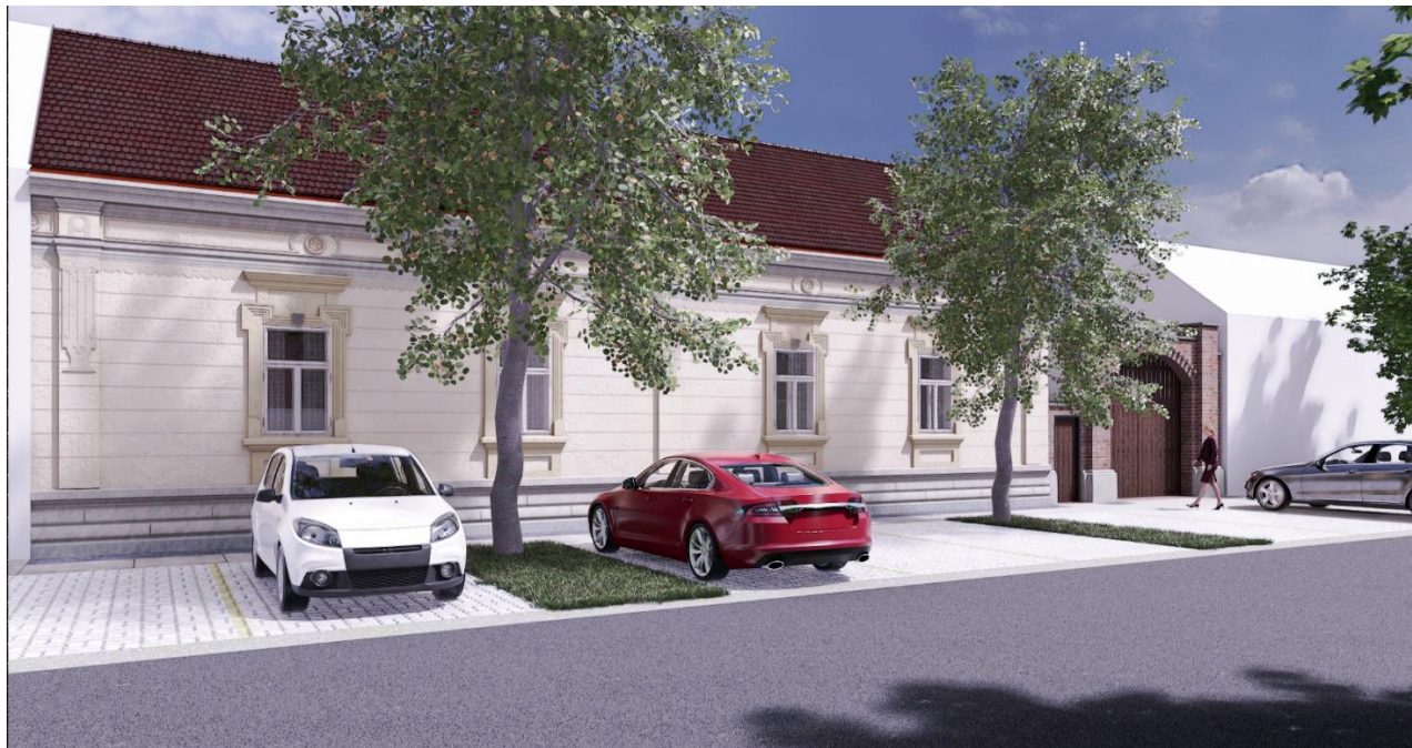
Vizualizacija – ulično pročelje glavne zgrade