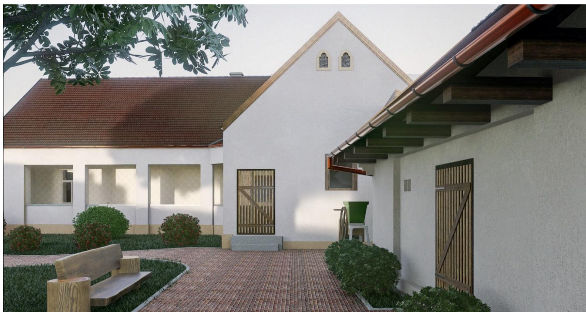
Vizualizacija – pogled iz dvorišta na glavnu zgradu sa trijemom